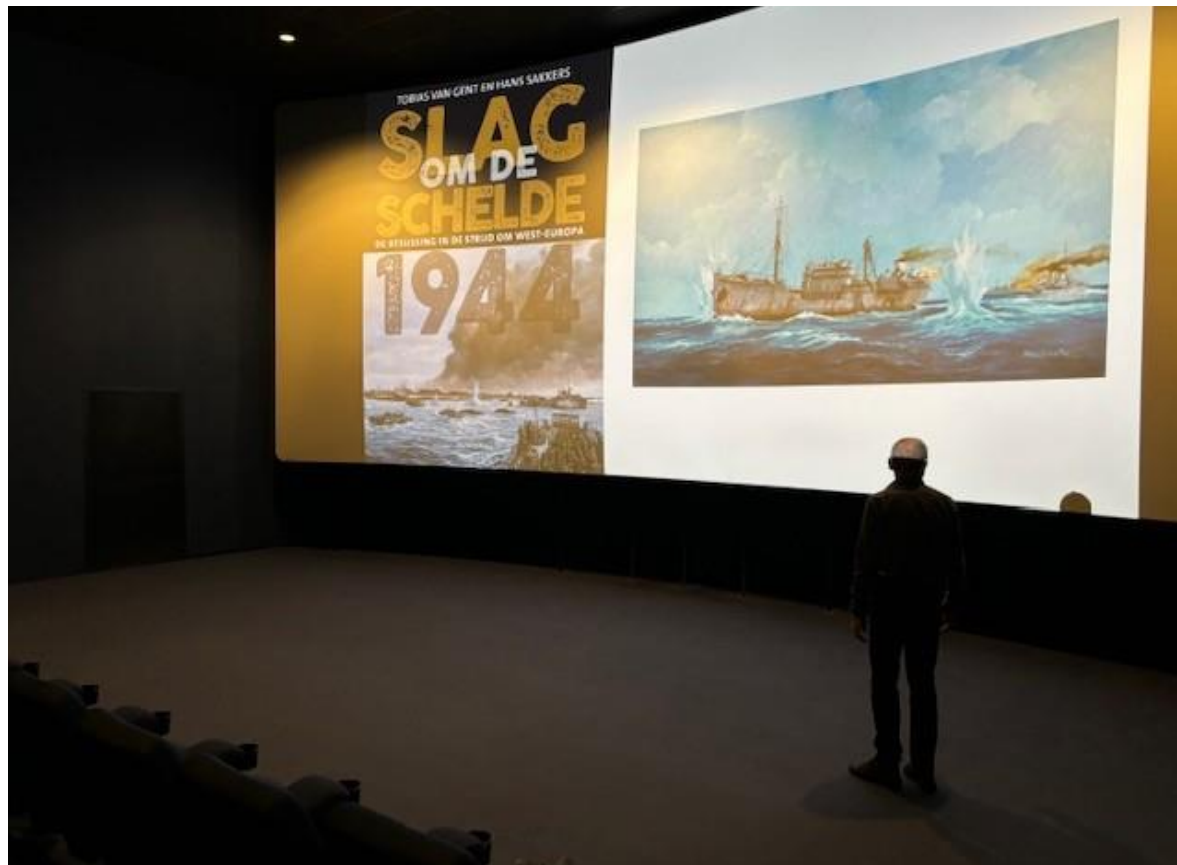
(m.b.t. afbeelding zeegevecht: betreft ikopie van schilderij, gemaakt door Fred Boom).