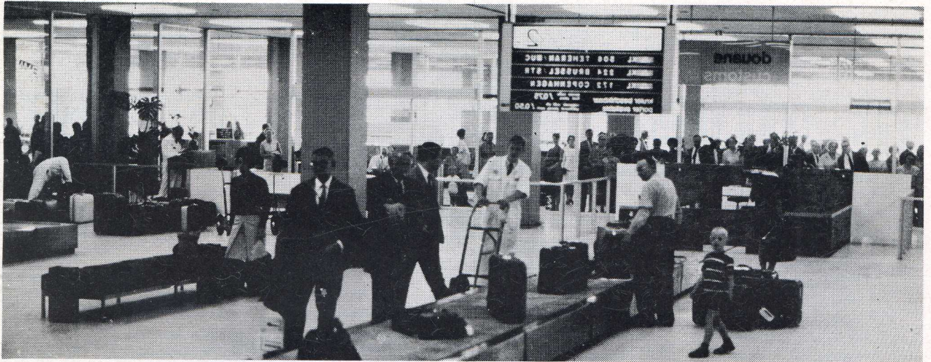
Familieleden, reikhalzend achter het glas bij de aankomsthal