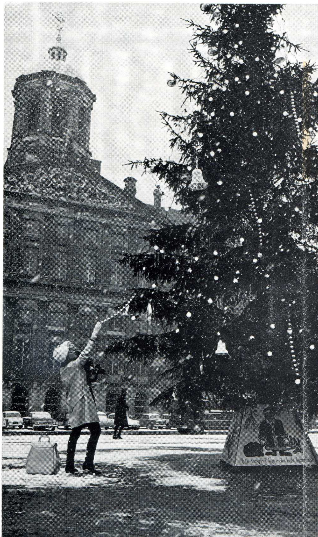
De enorme kerstboom op de Amsterdamse Dam vóór het paleis

Geachte lezeressen en lezers van Vogelvlucht,