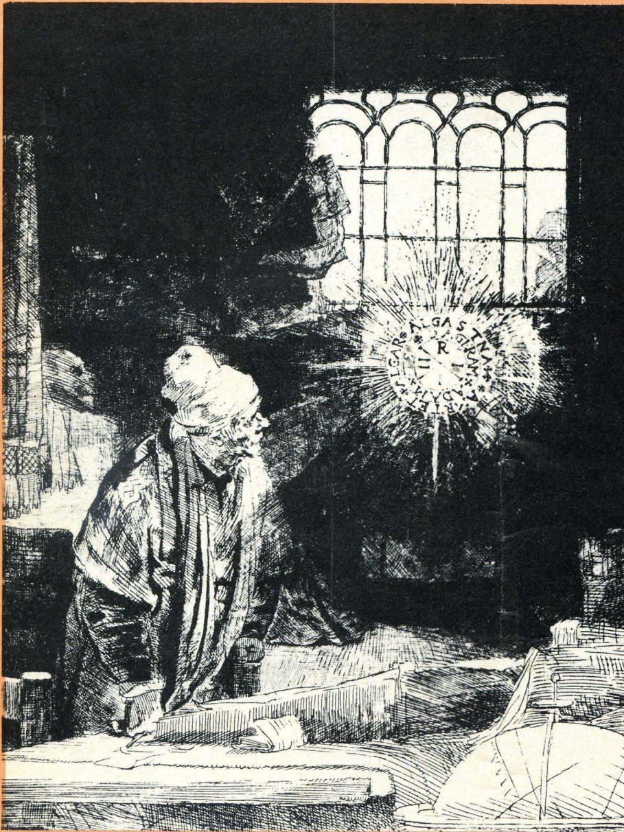
Boven: Rembrandts beroemde ets „Dr Faust in zijn studeerkamer”