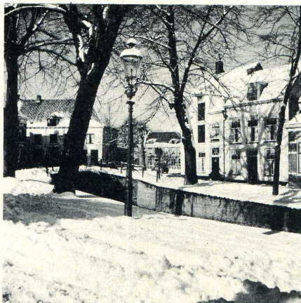
Een witte Kerstmis voor Amersfoort